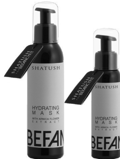
Hydrating Mask 200ml - 100ml