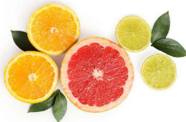
Mandarino, Arancio, Limone e Pesca

Dall'abbinamento di Arnica - una pianta officinale di antichissima tradizione - con il fresco e succoso Aloe nasce un mix cosmetico carico di freschezza e di energia rivitalizzante, che ha ispirato le note olfattive e la sensorialità dei prodotti, nati per stimolare dinamismo e voglia di ripartire.