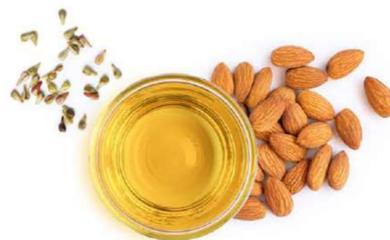
Oli Vegetali di Oliva, di Semi d'Uva e di Mandorla Dolce

I principi attivi contenuti negli estratti di frutta possiedono riconosciute proprietà antiaging: la loro attività antiossidante è preziosa per il benessere del nostro organismo. Agrumi e frutti del Mediterraneo - tutti coltivati in Italia - contribuiscono con un significativo apporto di Vitamine A, B e C a rinnovare la vitalità e la forza dei capelli. Sono naturalmente ricchi di zuccheri vegetali.