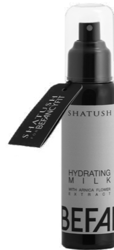
Hydrating Milk 100ml