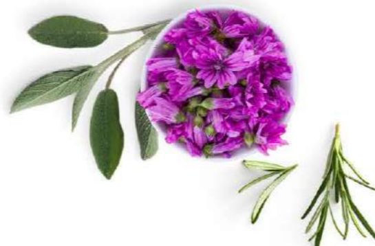
Foglia di Rosmarino, di Salvia, di Malva

Gli oli vegetali hanno una importante funzione estetica, sensoriale e nutritiva. Non solo aiutano a mantenere i capelli morbidi e luminosi, sono altresì portatori di acidi grassi essenziali, in assoluto i rigeneranti cellulari più efficaci nel contrastare l'azione degenerativa dei radicali liberi. Sono oli ricavati dalla spremitura di frutti e semi a freddo secondo procedimenti naturali e derivano da risorse non esauribili, seguendo un processo di raccolta e produzione ecosostenibile.