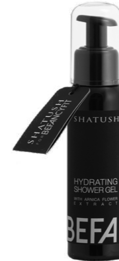
Hydrating Shower Gel 100ml