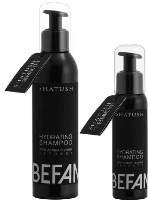
Hydrating Shampoo 250ml - 100ml