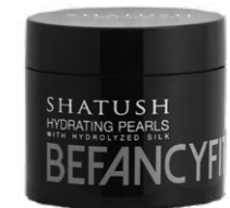
Hydrating Pearls 20 pz