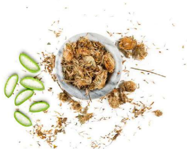
Arnica Montana e Aloe

Azione Purificante, Normalizzante, Rigenerante e Tonificante