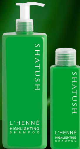
SHAMPOO RIFLESSANTE 1000 ml SHAMPOO RIFLESSANTE 250 ml